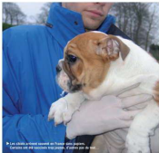
► Les chiens achetés souvent en France sans pedigree, certains ont été vendus très jeunes, à moins de 10 jours.

Les jeunes animaux d'actes de cruauté sur le chien Mambo, ont été condamnés : 2 mois de prison ferme pour le mineur et 6 mois de prison ferme pour sa complice, une jeune fille de 22 ans. Dans un village catalan, l'adolescent avait appris d'observer le chien et y avait mis le feu. Les équipes de la SPA ont déployé tous leurs moyens. Ils ont sauvé Mambo.